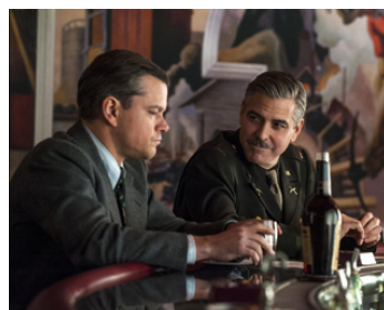
2014 MONUMENTS MEN (The Monuments Men) de George Clooney avec Matt Damon