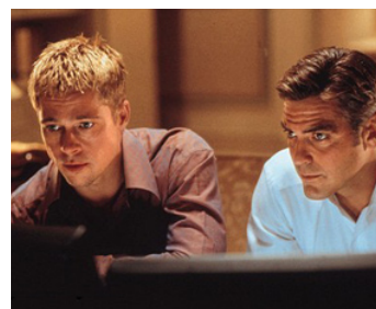
2001 OCEAN'S ELEVEN (Ocean's Eleven) de Steven Soderbergh avec Brad Pitt