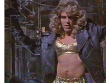
1993 THE HARVEST (The Harvest) de David Marconi