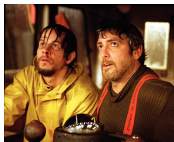
2000 EN PLEINE TEMPÊTE (The Perfect Storm) de Wolfgang Petersen avec Mark Wahlberg