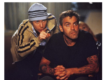
2002 BIENVENUE À COLLINWOOD (Welcome to Collinwood) d'A. et J. Russo avec S. Rockwell