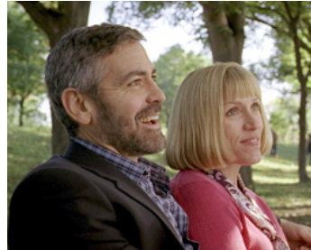
2008 BURN AFTER READING (Burn after reading) de Joel et Ethan Coen avec Frances McDormand