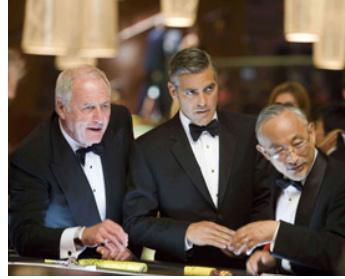
2007 OCEAN'S THIRTEEN (Ocean's Thirteen) de S. Soderbergh avec Jerry Weintraub