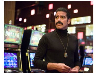
1996 SANG-FROID (Curdled) de Reb Braddock