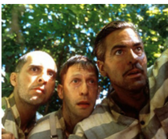
2000 O'BROTHER (O'Brother, where art thou ?) de J. et E. Coen avec J. Turturro, Tim Blake Nelson