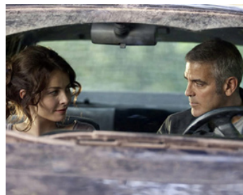
2010 THE AMERICAN (The American) d' Anton Corbijn avec Violante Placido