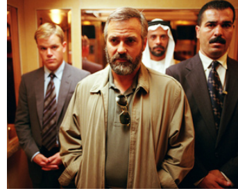
2005 SYRIANA (Syriana) de Stephen Gaghan avec Matt Damon