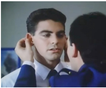
1986 ACADÉMIE DE COMBAT (Combat Academy) de Neal Israel