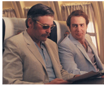
2002 CONFESSIONS OF A DANGEROUS MIND de George Clooney avec Sam Rockwell