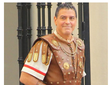
2015 HAIL CAESAR (Hail Caesar) de Joel et Ethan Coen