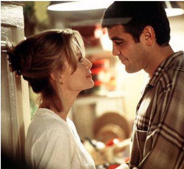
1996 UN BEAU JOUR (One Fine Day) de Michael Hoffman avec Michelle Pfeiffer