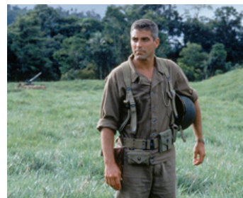
1998 LA LIGNE ROUGE (The Thin Red Line) de Terrence Malick