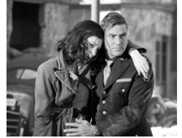
2006 THE GOOD GERMAN (The Good German) de Steven Soderbergh avec Cate Blanchett