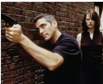
1997 LE PACIFICATEUR (The Peacemaker) de Mimi Leder avec Nicole Kidman