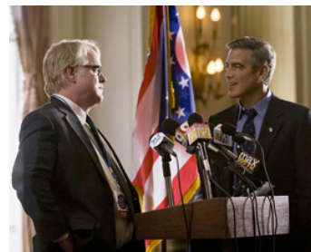
2011 LES MARCHES DU POUVOIR (The Ides of March) de G. Clooney avec Ph. Seymour Hoffman