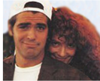
1992 LA BULLE MAGIQUE (Unbecoming Age) d'Alfredo et Deborah Ringel avec Diane Sallinger