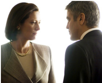
2007 MICHAEL CLAYTON (Michael Clayton) de Tony Gilroy avec Tilda Swinton