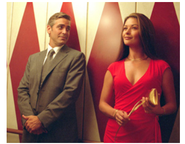
2003 INTOLÉRABLE CRUAUTÉ (Intolerable Cruelty) de E. & J. Coen avec Catherine Zeta-Jones