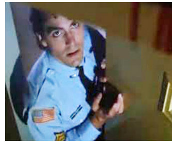
1987 RETURN TO HORROR HIGH de Bill Froehlich