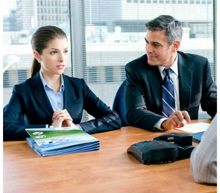
2010 IN THE AIR (In the Air) de Jason Reitman avec Anna Kendrick