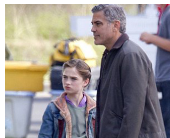
2015 TOMORROW LAND (Tomorrowland) de Brad Bird avec Tiffany Brissette