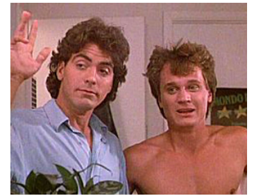
1988 LE RETOUR DES TOMATES TUEUSES (Return of the Killer Tomatoes) de J. De Bello avec St. Peace