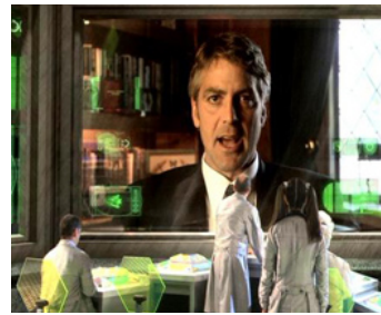
2003 SPY KIDS 3, MISSION 3D (Spy Kids 3, 3-D Game Over) de Robert Rodriguez