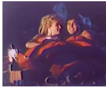
1987 GRIZZLY 2, LE PREDATOR (Grizzly II, the Predator) de David Marconi avec Laura Dern