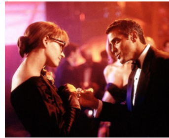
1997 BATMAN ET ROBIN (Batman and Robin) de Joel Schumacher avec Alicia Silverstone