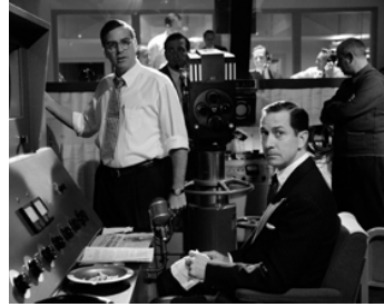
2005 GOOD NIGHT AND GOOD LUCK de George Clooney avec David Strathairn