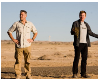
2010 LES CHÈVRES DU PENTAGONE (The Men who stare at Goats) de Grant Heslov avec E. McGregor