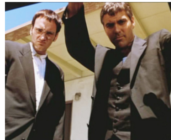
1996 UNE NUIT EN ENFER (From Dusk till Dawn) de Robert Rodriguez avec Quentin Tarantino