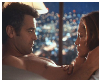
1998 HORS D'ATTEINTE (Out of Sight) de Steven Soderbergh avec Jennifer Lopez