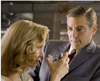
2008 JEUX DE DUPES (Leverheads) de George Clooney avec Renee Zellweger